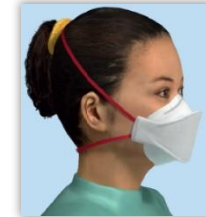
Atemschutzmaske mit Ventil